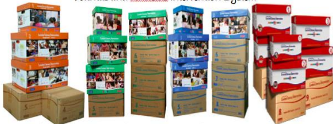
Orange Kit- Levels A-C, Green Kit- Levels A-J, Blue Kit- Levels C-N, Red Kit- Levels L-Q